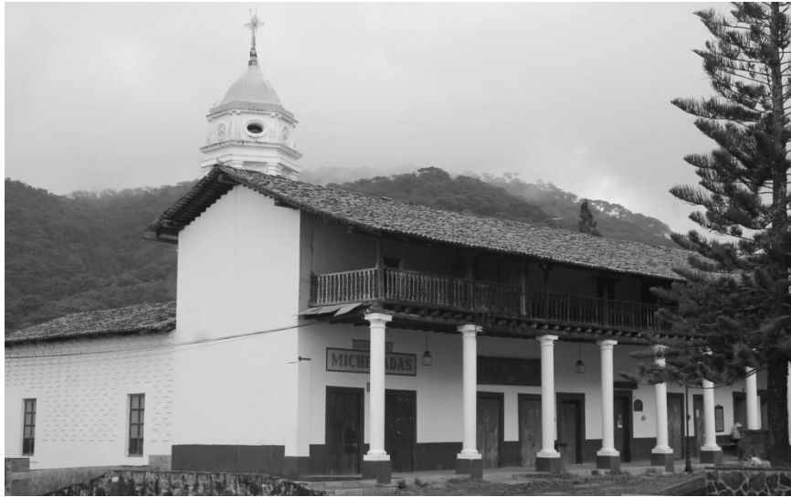
IMAGEN 4.- EL PORTAL MORELOS