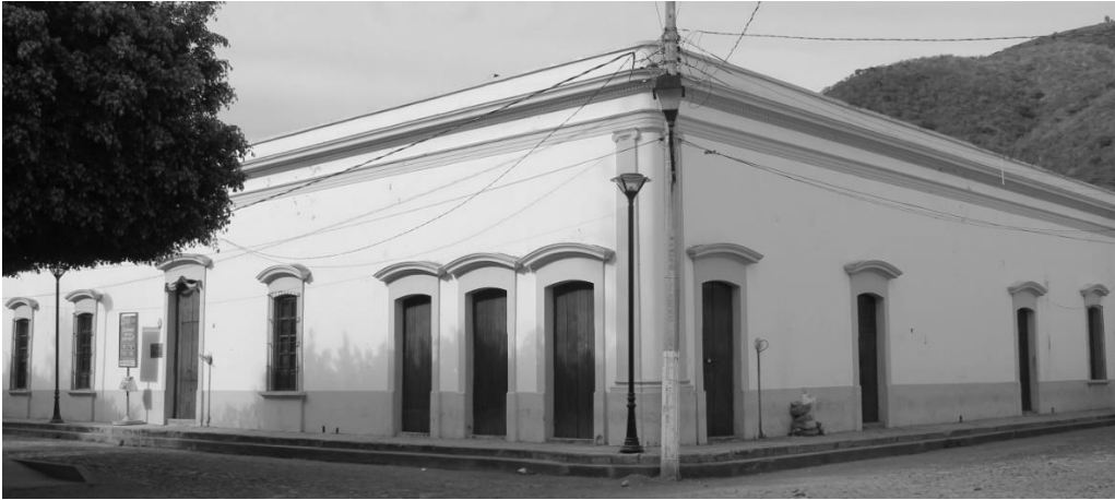
IMAGEN 5.- VIVIENDA TÍPICA EN XALA, AHORA LA CASA DE LA CULTURA

Una finca emblemática es la Casa de la Cultura que albergó a la familia Cambero; se erige en un solo nivel pero de generosas proporciones destacando por la solución compositiva de la esquina integrando tres ventanas verticales de bellas proporciones. El interior incluye un patio interior.