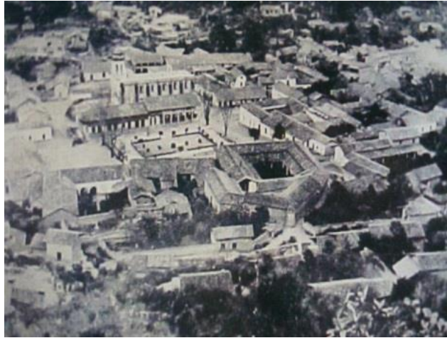
IMAGEN 1.- SAN SEBASTIÁN DEL OESTE HACIA 1880

La traza se integra con calles que se adecuan a las condiciones de la topografía, ramificándose en diversas direcciones, a manera de un intrincado rompecabezas orgánico y data de 1856 aproximadamente (Dueñas, 2010).