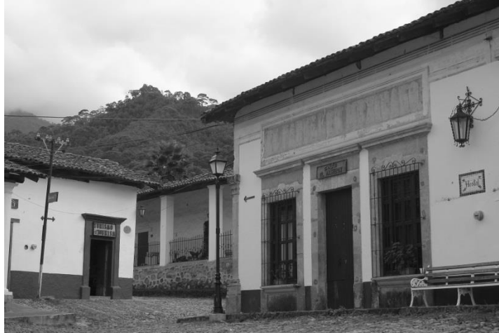
IMAGEN 3.- VIVIENDAS EN SAN SEBASTIÁN DEL OESTE