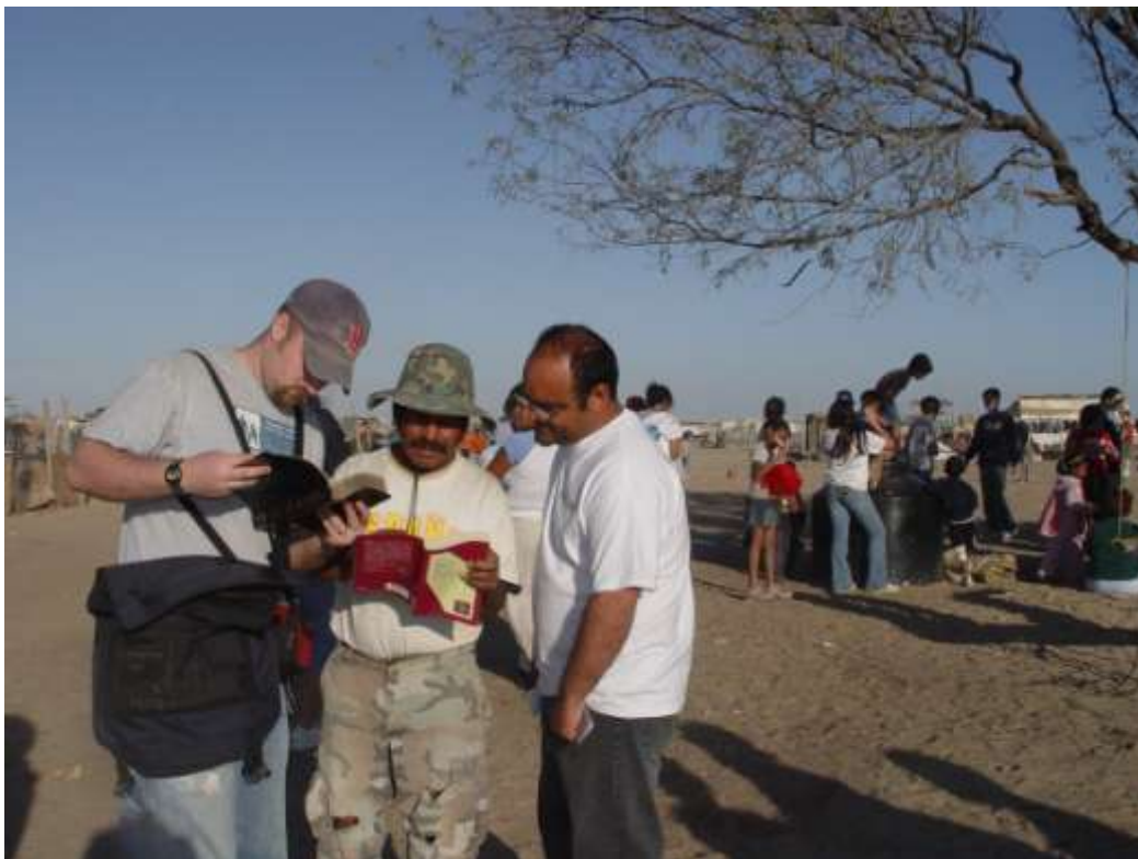
La enseñanza de la palabra de Dios, forma parte de la estrategia de acercamiento con los vecinos de la colonia Nuevo Peñasco.