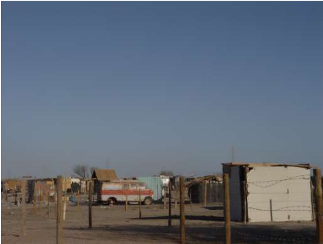
La colonia Nuevo Peñasco fue originalmente un asentamiento urbano irregular constituida con viviendas de materiales de cartón, madera y suelo urbano carente de servicios públicos.