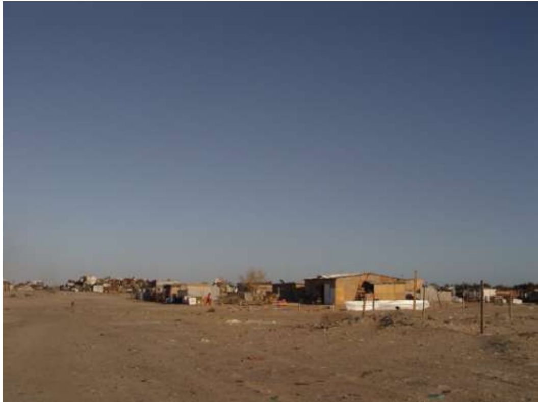
El trazo urbano de la colonia San Rafael lo realizó el Ayuntamiento local y cuenta con calles anchas y terrenos amplios; en cambio no goza de los servicios públicos.