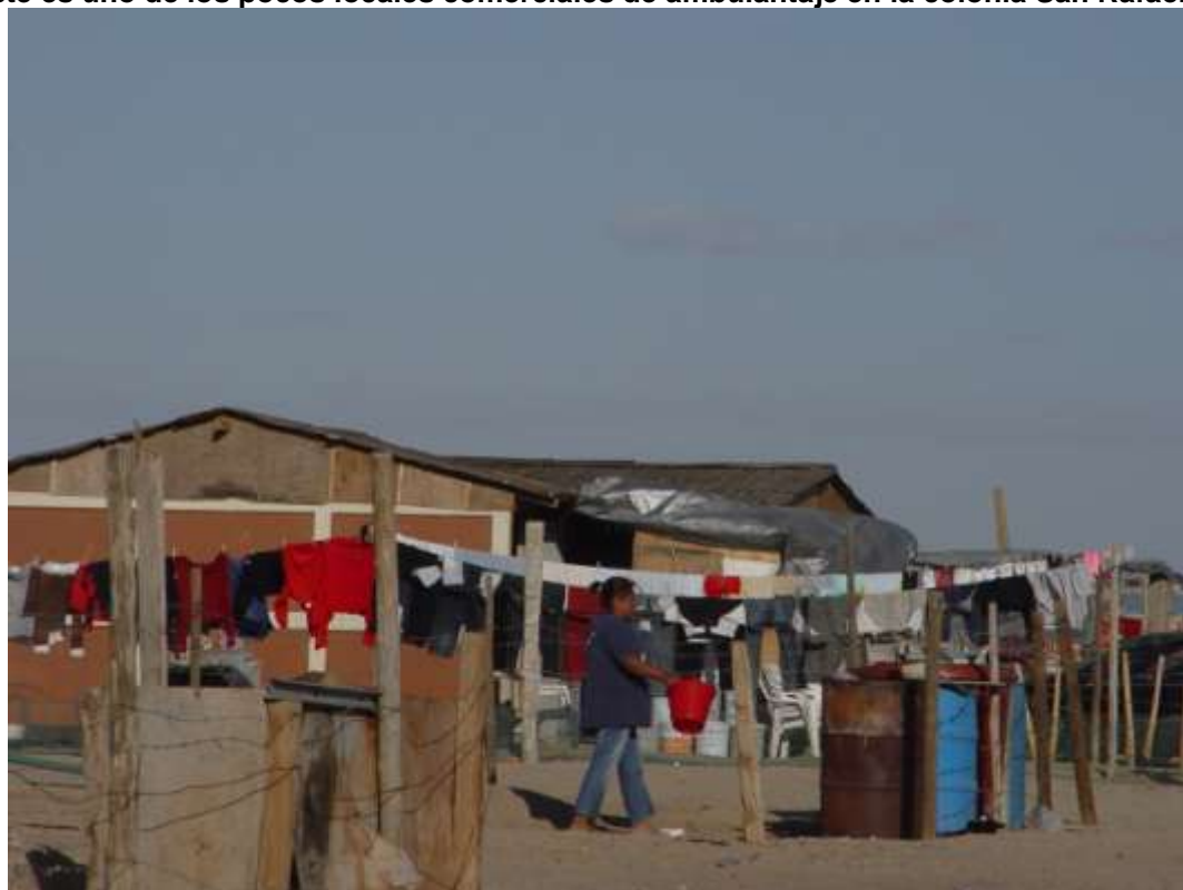
Escenas como ésta menudean en la colonia San Rafael; a la vista los recipientes de agua (tambos) que son surtidos del vital líquido por pipas particulares o municipales.