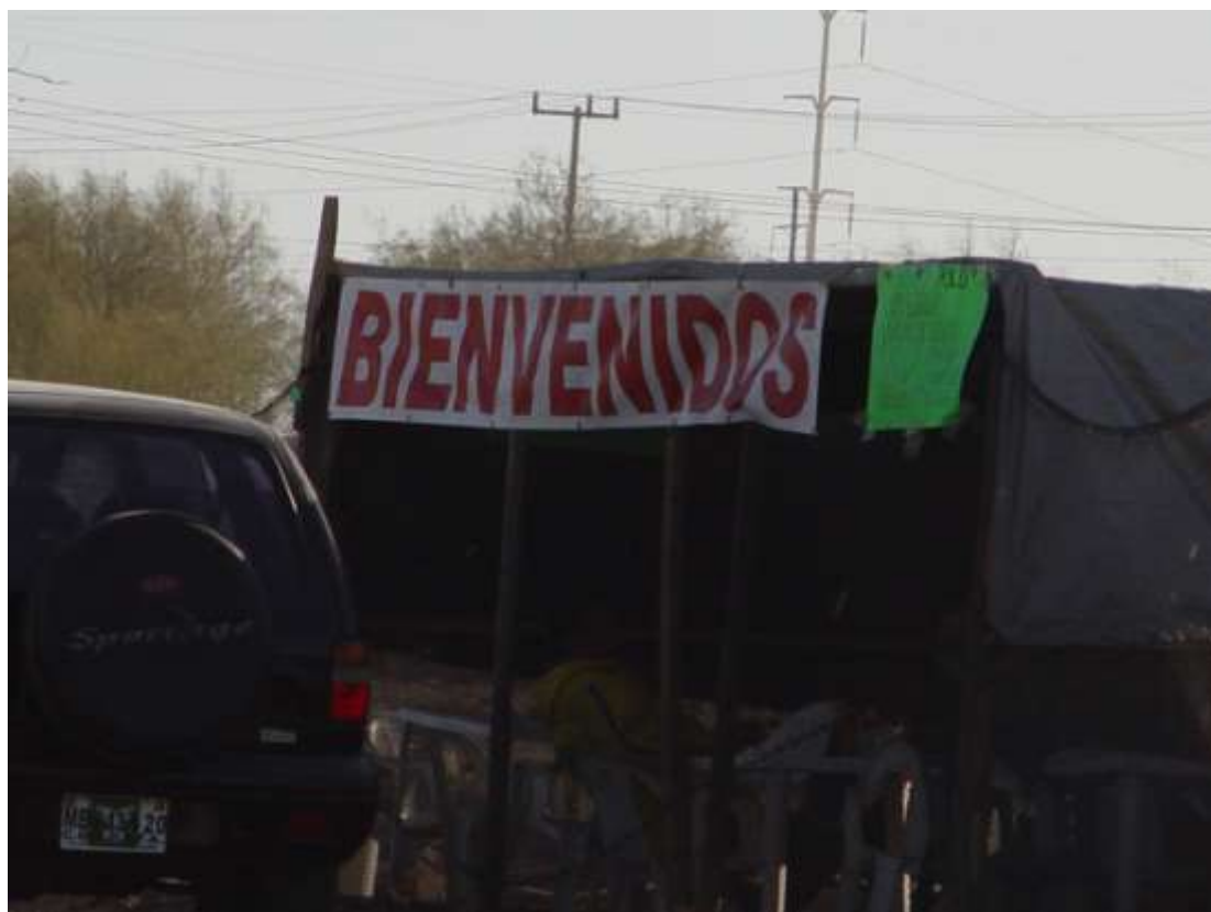
Este es uno de los pocos locales comerciales de ambulante en la colonia San Rafael.