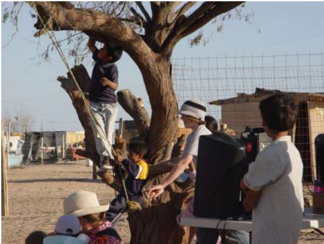
Organizaciones civiles norteamericanas con actividades religiosas visitan la colonia Nuevo Peñasco, con el objetivo de identificar carencias y ayudar a suplirlas. La convivencia y el reparto de comestibles es una práctica común.