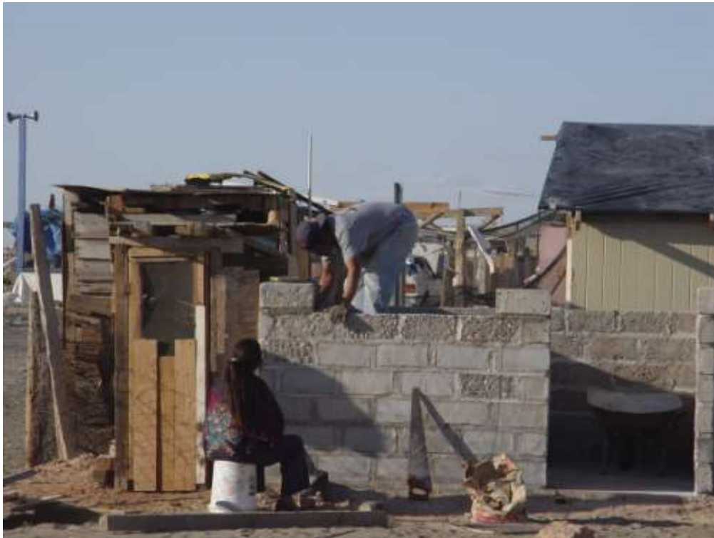
La autoconstrucción de vivienda es otra alternativa de los vecinos de la colonia Nuevo Peñasco.