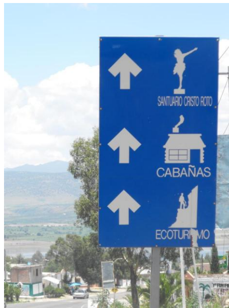
Imagen 1. Servicios turísticos en San José de Gracia

Los orígenes de San José de Gracia se remontan al grupo de chichimecas provenientes de Tepatitlan, Jalisco. Por el acoso de los españoles, se trasladaron hacia las tierras aledañas de la Sierra Fría, el cual con el paso del tiempo se llegaría a conocer como “de Marta”, hacia 1675.