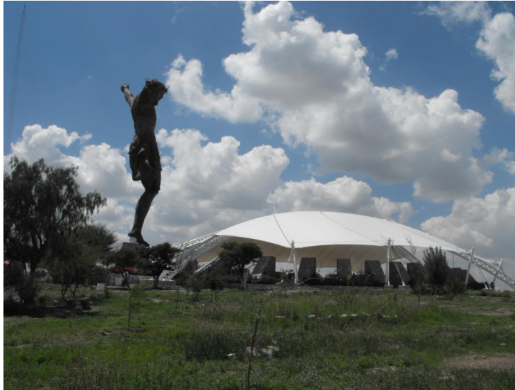
Imagen 3. Conjunto del Cristo Roto