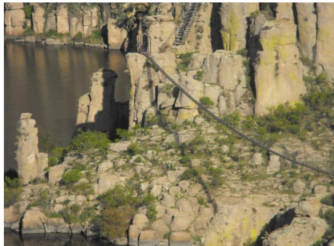
Imagen 5. Puentes colgantes

socioeconómicas que privan en el poblado. Este asentamiento carece de infraestructura que permita su fácil acceso, además de las condiciones naturales como el suelo rocoso, y la poca precipitación pluvial, provocaban que los habitantes emigraran hacia otras sitios buscando oportunidades de subsistencia. La comunidad cuenta con cien personas, la cual tiende a decrecer por la falta de oportunidades para generar ingresos económicos constantes. Ante esta situación, el Gobierno del Estado proyecto un desarrollo turístico que contemplara instalaciones tendientes al eco turismo así como al turismo de aventura. La propuesta contempló puentes colgantes, tirolesas ( Ver Imagen 5 ), instalaciones para la escalada, un circuito de bicicross y a pie a campo traviesa, lanchas, así como el cañón, la presa y el paso por el túnel.