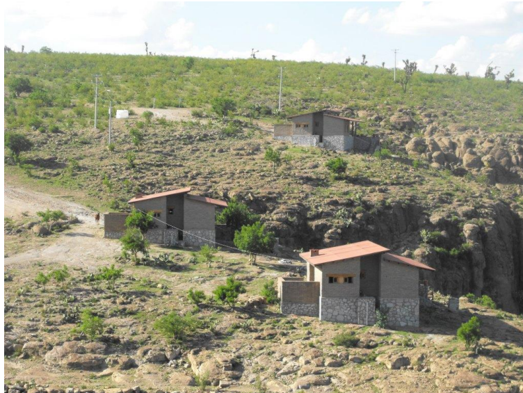
Imagen 6. Cabañas

caliente y fría, estancia, comedor, cocineta con refrigerador, estufa, platos y cucharas y horno de microondas; en el exterior una terraza cubierta con vista al cañón. También se ofrecen –aunque sin éxito- “...los servicios de hospedaje y alimentación dentro de las casas de los habitantes de la comunidad a turistas nacionales y extranjeros ya que para ellos es interesante la convivencia con la gente y observar la forma de vida, los usos y costumbres.” 13