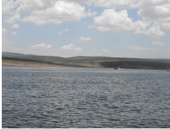
Imagen 2. Presa “Presidente Plutarco Elías Calles”