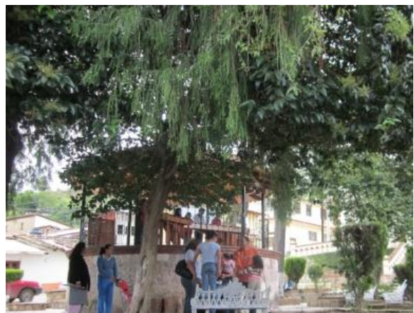
Plaza Capulálpam de Méndez, Oaxaca