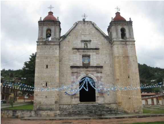
Templo de San Mateo Apóstol