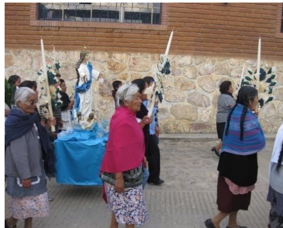
Procesión de la Virgen de la Asunción