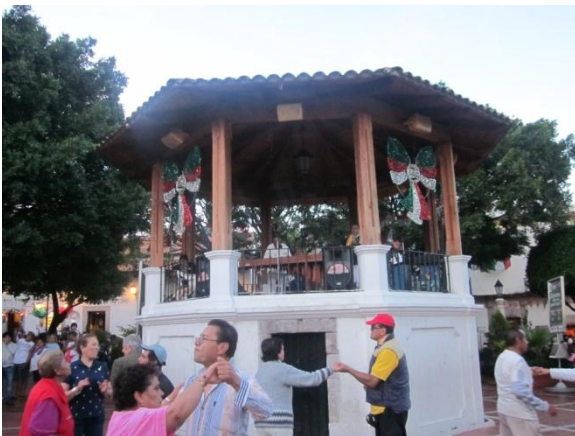
Plaza Taxco, Guerrero