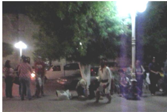
Plaza El Fuerte, Sinaloa