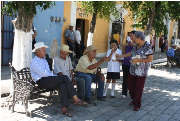
Corredor Cosalá, Sinaloa