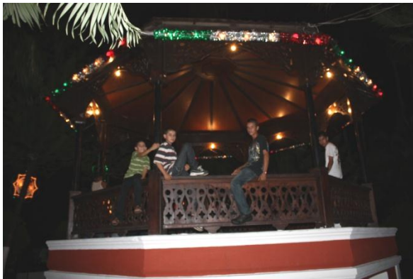
Plaza Cosalá, Sinaloa