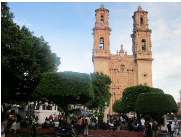
Plaza Taxco, Guerrero