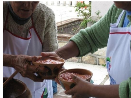
Bebida tradicional Oaxaqueña, Pinole