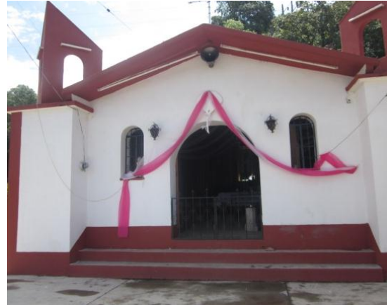
Mirador Natural El Calvario