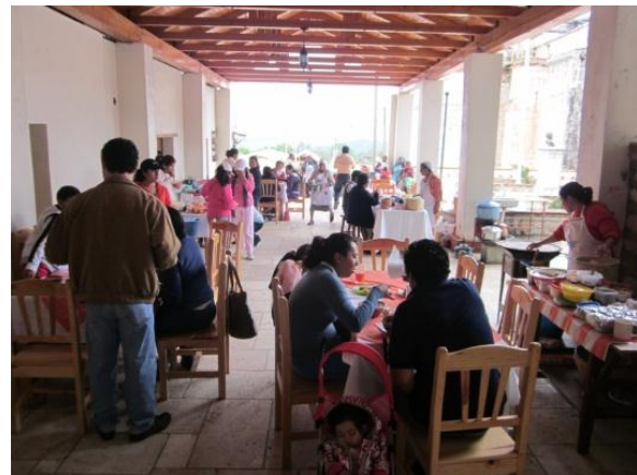
Corredor turístico Capulálpam de Méndez, Oaxaca