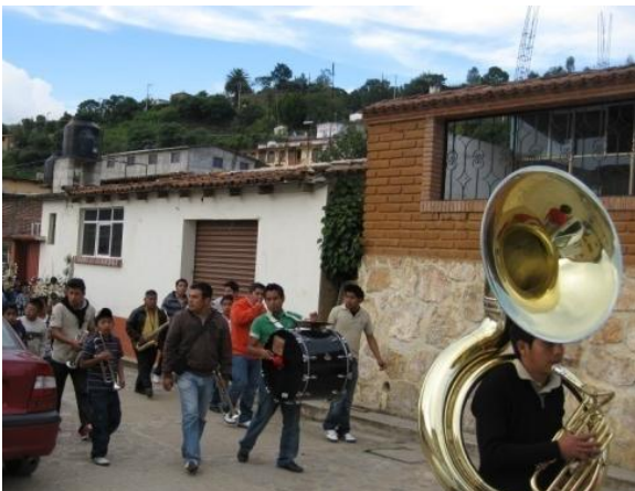
Celebraciones del barrio de la Asunción