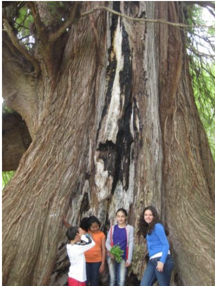
Imagen 3. Escenarios paisajísticos de ficción en Capulálpam de Méndez

propiedad de Montreuil, a las puertas de París. La idea del primer trucaje le fue sugerida accidentalmente, Proyectando un film que había tomado en la Place de l'Opéra, tuvo la sorpresa de ver un autobús Madeleine-Bastille transformarse bruscamente en una carroza fúnebre. Un poco de reflexión le reveló la causa de aquella metamorfosis: la película se había detenido y después siguió normalmente la toma de vistas.”