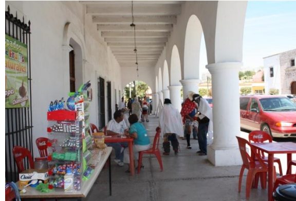
Los Portales El Fuerte, Sinaloa