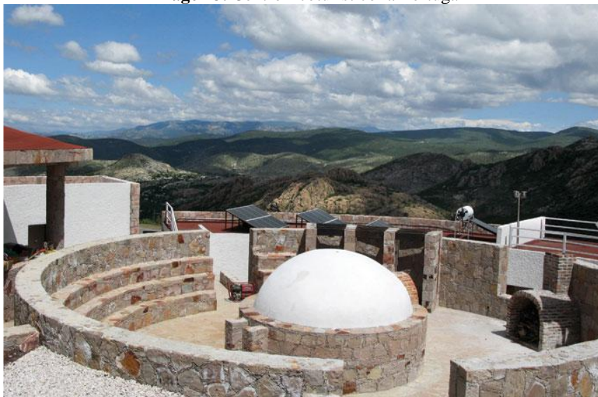
Imagen 3. Centro Ecoturístico la Tortuga

Periodo de Investigación Marzo de 2010