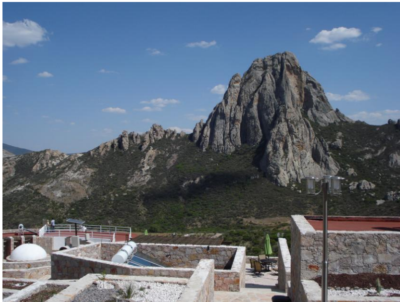
Imagen 1. Peña de Bernal vista desde el centro Ecoturístico la Tortuga

Periodo de Investigación Marzo de 2010