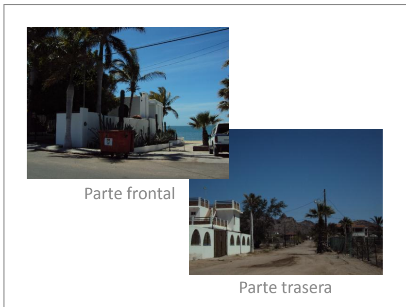
Imagen 3. Kino Nuevo, parte frontal y parte trasera.

Kino es un lugar de dualidades como es común en todas las playas de la república mexicana. Hay una parte frontal, maquillada para turistas y una parte trasera que pertenece a los nativos del lugar que lo hacen funcionar. En nuestro recorrido nos avocamos a apreciar la parte frontal de Kino Nuevo. Nuestra interpretación es solo una entre muchas posibles lecturas. Al entrar a la avenida Mar de Cortés y no ver los grandes hoteles que caracterizan otros sitios vacacionales, se advierte una vocación distinta del lugar, como destino turístico regional. Se siente como una comunidad tranquila, las casas son limpias y sin graffiti, inspirando una seguridad que es reafirmada por la presencia de policías. Quienes habitan este lugar son personas mayores, retirados, que a juzgar por las antenas de televisión satelital pueden llevar una vida confortable en un sitio como este. A pesar de la falta de áreas verdes, se puede sentir un contacto cercano con la naturaleza, por ejemplo, al estar en contacto con las gaviotas en la playa.