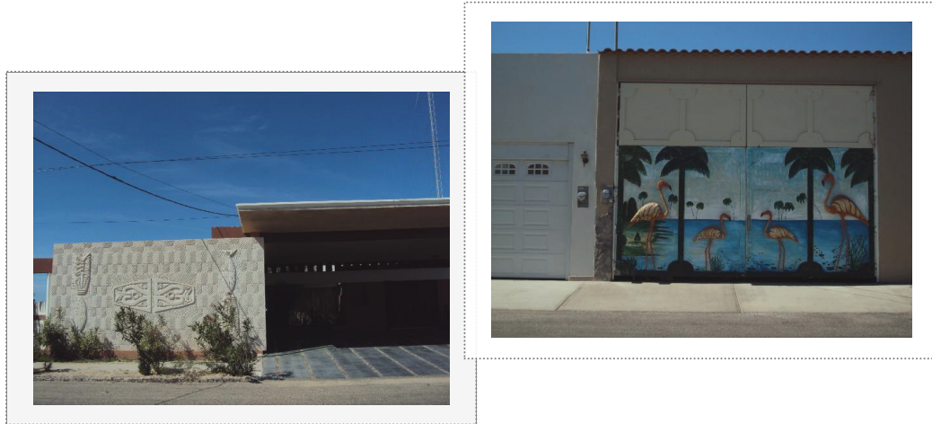
Imagen 2. Kino Nuevo, fachadas

tendrá que regresar a su casa en Kino Viejo y “pedir fiado” en la tienda de la esquina, para pasarla mientras llegan más turistas y venderles su mercancía.