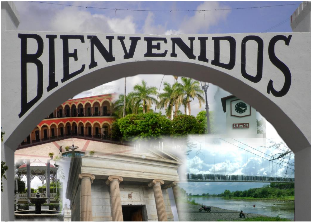
Foto 2 Lugares Emblemáticos de El Fuerte Sinaloa México El Fuerte Sinaloa, 18 de agosto de 2012 | Fuerte Sinaloa, México.

El concepto de “imaginario social” fue creado por Cornelius Castoriadis (1978) en el que plantea es la forma de concebir al mundo en toda la gama de sus significaciones. Sin embargo hemos encontrado en nuestra investigación dos “Significados” del imaginario social: el sentido que se percibe a través de la imagen icónica y el sentido que se percibe a través de lo imaginario, lo deseable.