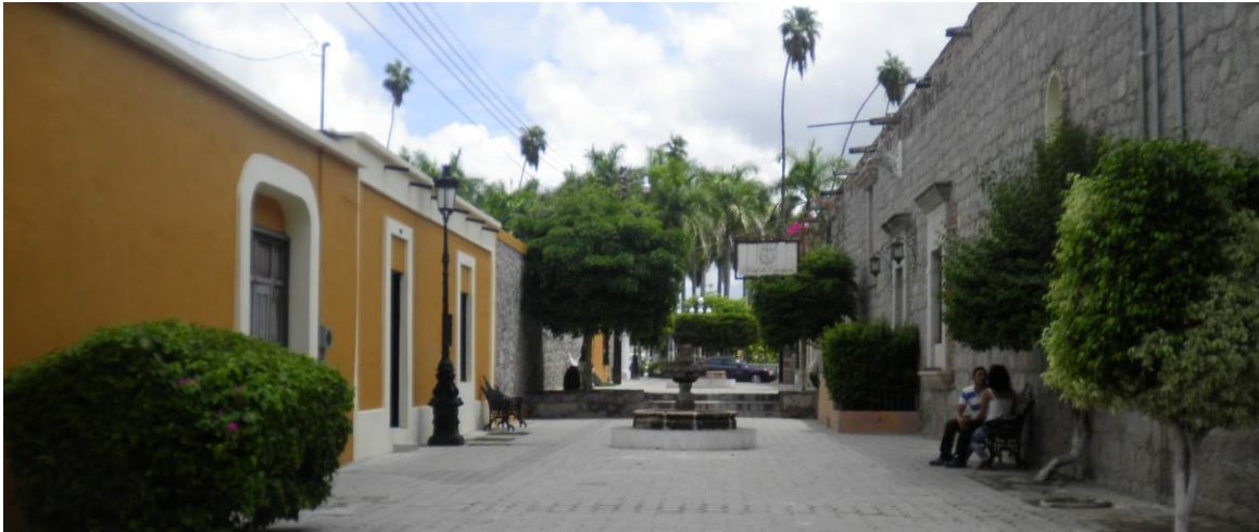
Foto 3 Callejón de la Juventud El Fuerte Sinaloa, 18 de agosto de 2012| El Fuerte Sinaloa, México

En ese sentido las indagaciones a través de la imagen fotográfica y la narrativa a través de la entrevista identificamos el Significado social que le dan los pobladores a los lugares Emblemáticos en su Región de El Fuerte, actualmente “Pueblos Mágicos”. A continuación diferentes apreciaciones de Imaginario Social de los Lugares Emblemáticos en el Pueblo Mágico de El Fuerte a partir de la Imagen en las narrativas de los pobladores desde sus perspectivas.