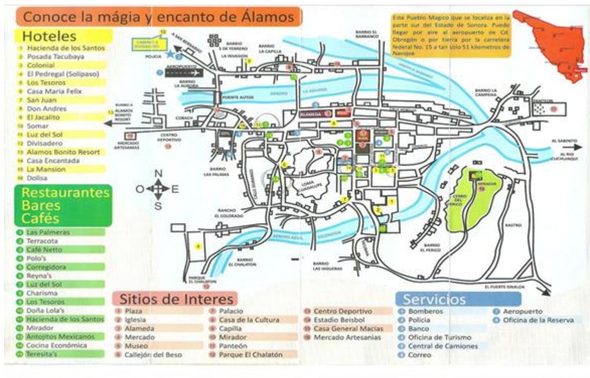
Imagen 1: