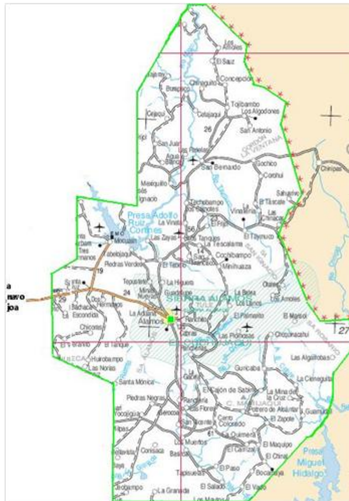
Imagen 2:

La economía local tiene sustento en la cría y venta de ganado, la extracción de productos forestales y la ocupación de los integrantes de las comunidades rurales en jornaleros de los ranchos productores de ganado en gran escala. La agricultura se practica para autoconsumo con alto grado de siniestralidad como resultado de las limitaciones económicas prevalecientes. Dice Elvira Rojero que la pobreza rural y el número de personas ligadas a la